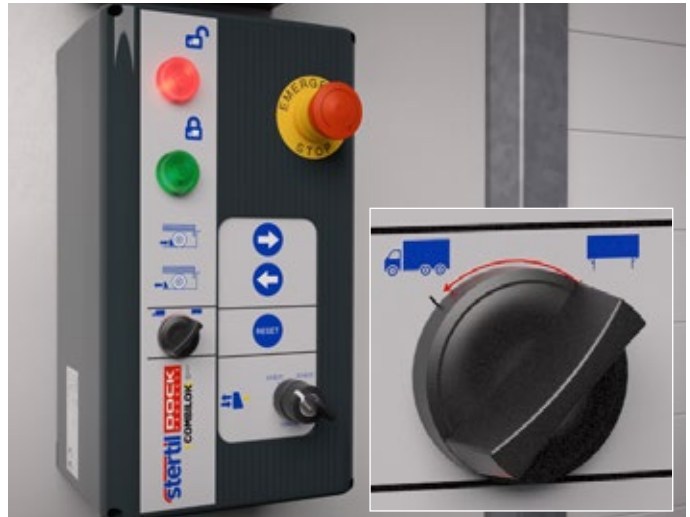
Swap body konteynerden araç seçeneğine dönüş

Opsiyonel Stertil güvenlik devresi; rampa, kapı ve trafik ışıklarının senkronizasyon sıralamasını güvenli bir şekilde aynı anda kontrol etme işlevselliğine sahiptir.