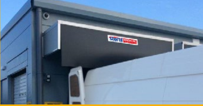
Rüzgar ve yağmura karşı özel olarak tasarlanmış çatı