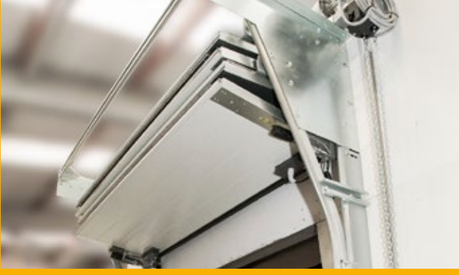
Akıllıca tasarlanmış katlanır kapı