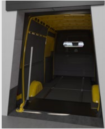
Depo alanı içerisinden rampa görünüşü