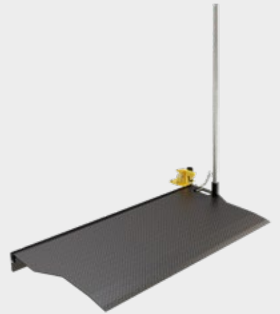
Van Bridge Plate mini rampa